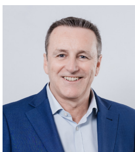
Marc Delage VICE-PRÉSIDENT DU CNIEL

Un commerce alimentaire dans une commune sur trois, 750 000 emplois sur l'ensemble du territoire : la distribution irrigue l'économie des territoires jusque dans les zones les plus rurales. Pour les élus, c'est un levier concret de dynamisme et un atout pour valoriser leur terroir.